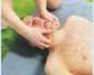
Если рот не открывается, рот и нос пострадавшего зажать пальцами, надавив на подбородок, и надавить на подбородок пальцем или другим предметом.